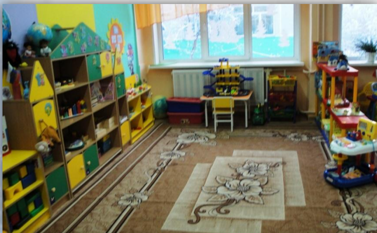
Зона средней активности