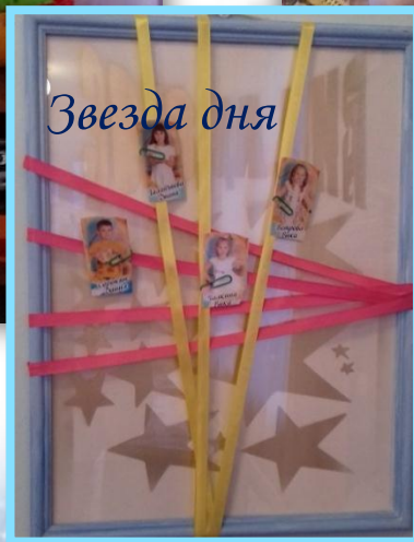
Ковёр - Дружбы