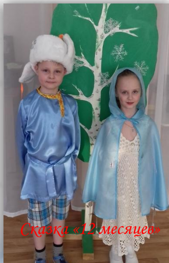
Сказка «12 месяцев»