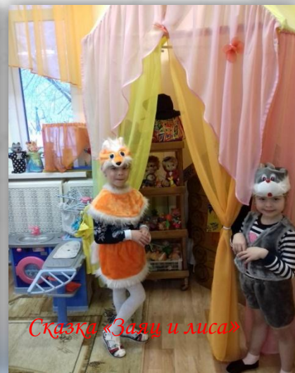
Сказка «Заяц и лиса»